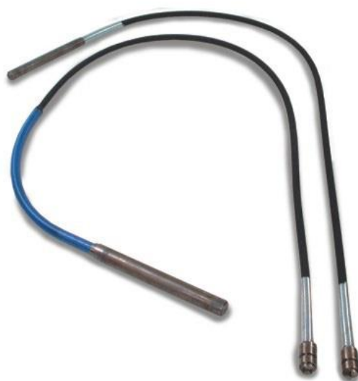
VIBRADOR DE IMERSÃO PENDULAR - VIP – 38 - VIP – 45