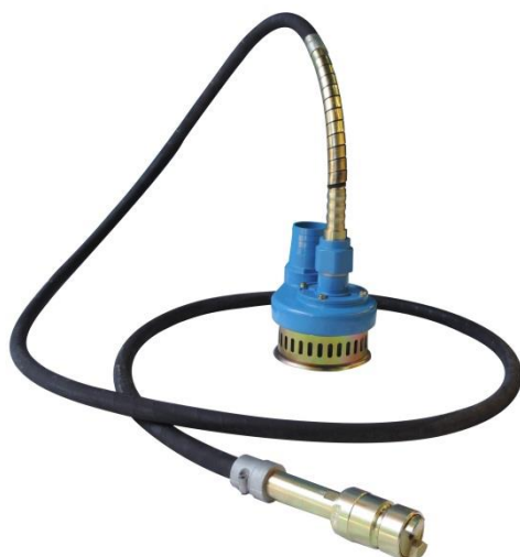
BOMBA SUBMERSÍVEL DE MANGOTE - BWA500 – AL